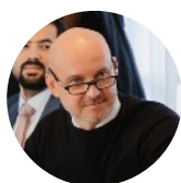
Branislav Gröhling Sloboda a solidarita